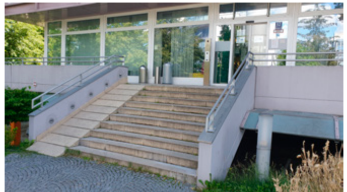
„nicht“ barrierefreie Rampe

Inklusionsbaustellen gibt's leider halt immer noch überall.